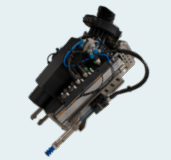
SCAPE Tool Unit mit SCAPE Grid Scanner & Greifern