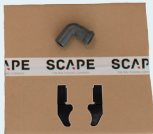
Beispielteile zum Testen des Setups