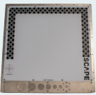
CAST Station für Kalibrierung und Selbsttests