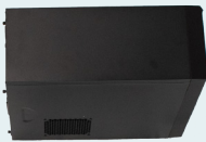
PC mit vorinstallierter SCAPE Software Suite