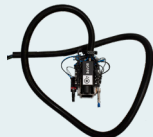
Kabel für die Hardware & Energiekette für Ihren Roboter